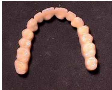
Abb. 8: Okklusalanzeige LZ-PV.

molog verwachsen und liegen spaltfrei an den Implantatgewinden an. Es gibt keinerlei Anzei-