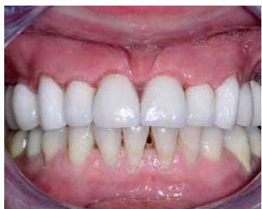
Abb. 11: Situation nach Fertigstellung in der Frontalanzeige in situ.

ten, in denen der Knochen gezüchtet wird, ist sicherlich ein Nachteil gegenüber den etablierten Verfahren der enorale Knochenentnahme. Die Kosten dieses Verfahrens sind vergleichsweise hoch, abhängig von der Menge der gezüchteten Bone-Chips, und verursachen bei einem beidseitigen Sinuslift Kosten in Höhe von