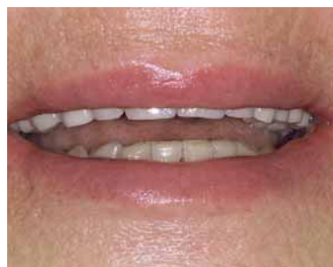
Abb. 13: Situation nach Fertigstellung, Lippenbild.