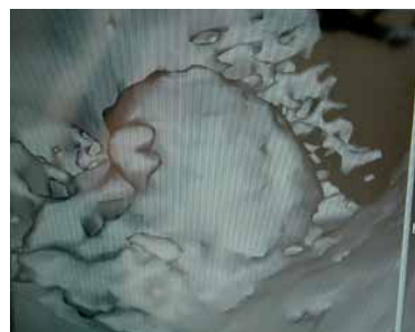
Abb. 16: 3-D-Darstellung des Sinuslifts mittels Robodent, Navigation im II. Quadranten.

ca. 8.000 Euro. Generell stehen als Alternativen zum Knochenaufbau noch die enorale Entnahme an Kinn oder Kieferwinkel zur Verfügung. Da die enorale Entnahmepotenziale im reduzierten