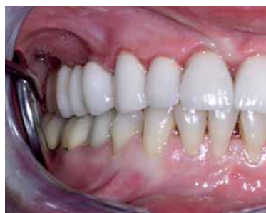
Abb. 12: Situation nach Fertigstellung, Seitenansicht rechts.