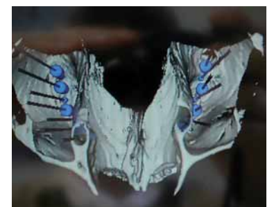
Abb. 7: Blick von kranial in die Kieferhöhle in der 3-D-Darstellung.

der Knochenchips nach zwei Jahren und vier Jahren mittels eines 3-D-generierten Bildes des Oberkiefers. Das Orthopantomogramm (OPG) zeigte in Regio 14 bis 17 und 24 bis 27 ein reduziertes Knochenangebot in vertikaler Dimension.