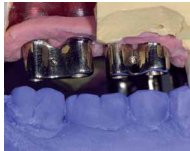
Abb. 9: Modellsituation mit verblockten und Horizontalverschraubungen, Primärteleskopen im I. Quadranten nach dem Registrat.

narkose ist ein stationärer Klinikaufenthalt von drei Tagen nötig. Postoperativ muss die Entnahme-