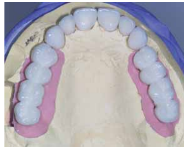
Abb. 10: Prothetik auf dem Modell.

Rahmen der Implantation eingesetzt werden kann. Diese systembedingte Pause von zwei Mona-