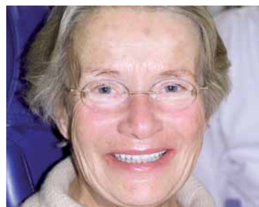
Abb. 14: Situation nach Fertigstellung, en face.

die vorbereiteten Hohlräume der Kieferhöhle. Dann erfolgte die navigierte Implantation von jeweils vier Implantaten (Länge 15 mm, Durchmesser 3,75 mm, Osseotite 3i Implant Innovation) und drei Übergangsimplantaten (IPI Nobel Biocare, Länge 14 mm, Durchmesser 1,2 mm). Danach wurden die Bone-Chips zirkulär um die Implantate angelagert. Die Implantate 25 bis 27 sowie 16 und 17 wurden mittels einer SIS-Platte (Mondeal) im Sinne einer Osteosyntheseplatte mit vier 12mm langen Schrauben nach dem sogenannten Göttinger Satellitenmodell fixiert, um eine zusätzliche Primärstabilität und sichere Einheilung der Implantate zu gewährleisten. Abschließend wurde die provisorische Kunststoffbrücke auf den sechs IPIs und den sechs Frontzähnen von 17 bis 27 mit Improvizement (provisorischer eugenolfreier Acrylzement, Nobel Biocare) zementiert. Nach achtmonatiger Einheildauer erfolgte die Implantatfreilegung und die Entfernung der SIS-Platten und IPIs. Auf dem Meistermodell wurden sodann teleskopierend abnehmbare Brücken mit sekundärer palatinaler Verschraubung angefertigt sowie in der Front sechs Vollkeramik-Cercon-Einzelkronen. In den darauf folgenden Behandlungssitzungen wurden Gerüstanprobe und Rohbrandanprobe durchgeführt, bevor in der definitiven Behandlungssitzung die Restaurationen eingegliedert wurden.