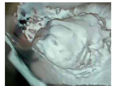
Abb. 17: 3-D-Darstellung der Augmentierung mit BioSeed®-Oral Bone

anderen wird gleichzeitig eine Zeiteinsparung von drei Monaten erreicht. So kann die Sinusliftoperation von einem zeitraubenden und recht traumatischen Eingriff (zweiphasig) zu einem atraumatischen und zeitsparenden Operationsverfahren gewandelt werden. Der behandlerische und finanzielle Mehraufwand der Implantatnavigation führt zu einer nachweislichen Effizienzsteigerung der Achsoptimierung und damit zu einer optimaleren prothetischen Versorgung im Besonderen bei der Freundsituation von Regio 14 bis 17 bzw. 24 bis 27 und rechtfertigt nach den Ergebnissen der retrospektiven Studie von Luckey et al. 2006 die routinemäßige Einsetzbarkeit des Navigationssystems Robodent®. Bei den kleinen Schalllücken und unter Kenntnis der anatomischen Besonderheiten in der Oberkieferprämolarenregion ist die Navigation, wie auch die Ergebnisse der retrospektiven Studie von Luckey et al. 2006 zeigen, nicht erforderlich. 10 Conditio sine qua non für einen routinemäßigen Einsatz bei der subantralen Augmentierung mit vitalem autogenem Transplantat aus Periostzellen ist aber der Erhalt dieser Strukturen über einen langen Zeitraum. Die CT-Nachuntersuchung des eingebrachten autologen vitalen Knochenzellmaterials zeigt nach vier Jahren stabile Verhältnisse. Damit zeigt dieses moderne Verfahren der Biotechnologie einen für den Patienten wenig belastenden Knochenaufbau auf, das insbesondere im Bereich der atrophien