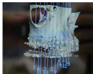
Abb. 5: Seitenansicht der 3-D-Simulation im I. Quadranten.