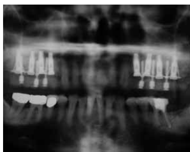
Abb. 3: Postoperative Röntgenkontrolle mittels Orthopantomogramm (OPG) mit Bonechips Implantaten SIS-Platte und Übergangsimplantaten, auf denen das intraoperativ inserierte PV fixiert wurde. Als typischer Befund ist beim postoperativen Kontroll-OPG der augmentierte Bereich nur schwach darstellbar und der Kieferhöhlenboden noch eindeutig abgrenzbar.

Zunächst erfolgte die Simulation des möglichen Behandlungsergebnisses nach Wax-up und Schienenherstellung mittels Computertomografie und Navigation. Dadurch war es möglich, das prospektive Ergebnis vor Behandlungsbeginn abzuschätzen