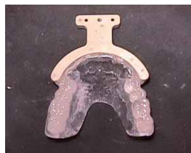
Abb. 4: Okklusalanalyse der Bisschiene mit Navigationsbogen.