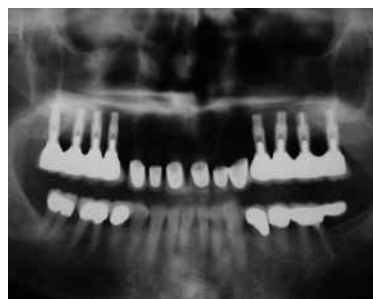
Abb. 15: Röntgenkontrolle im OPG nach Eingliederung der teleskopierenden Brücken und Cercon-Kronen nach acht Monaten. Deutlich erkennbare Zunahme der röntgenologischen Verschattung als Hinweis auf die knöcherne Regeneration im Bereich des Sinusaugmentats mittels Bone Chips.

zellen osteoinduktiven Knochen zu generieren, ist eine inzwischen in unserer Praxisklinik etablierte Methode, weil er eine hohe knochenähnliche Struktur hat, sich locker anlagert, formstabil ist